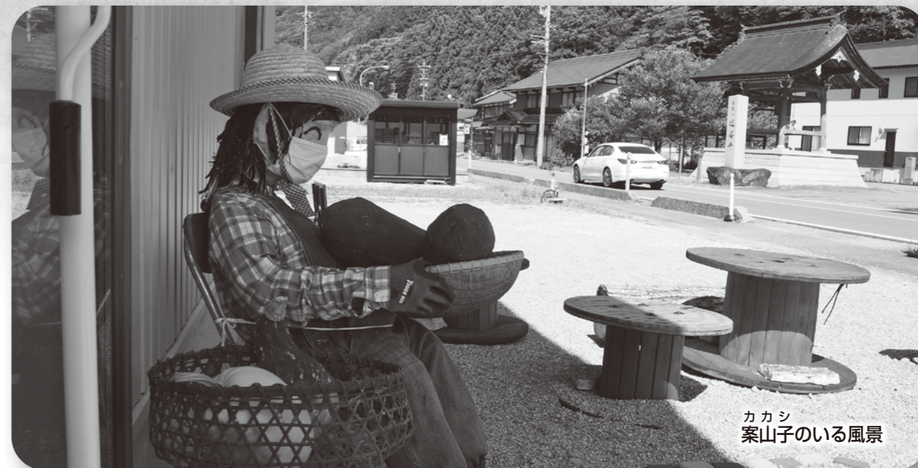
カカシ 案山子のいる風景